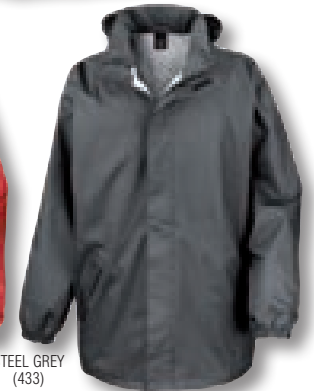
STEEL GREY (433)