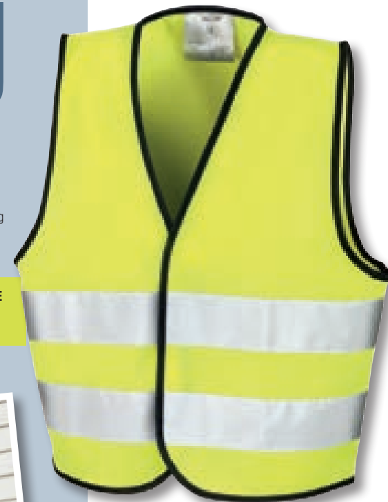
FLUORESCENT YELLOW (394)

HINWEIS: FÜR GRÖSSTMÖGLICHE SICHERHEIT SOLLTE DIESES KLEIDUNGSSTÜCK GUT BEFESTIGT UND IN SAUBEREM ZUSTAND GETRAGEN WERDEN